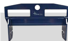
Art. Nr. 28373: Böhler Lift 250

Neue, leichte Hebetrasse nach EN 13155 für den bequemen und sicheren Transport von Böhler Welding BASEdrum™, CLIMAdrum™ und ECOdrum™ mit Gabelstapler oder Brückenkran. CE-Zulassung.