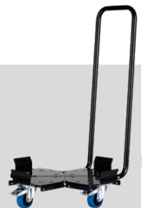
Art. Nr. 28549: Universeller Rollwagen

Universeller Rollwagen für runde und achteckige Fässer aller Typen und Größen.