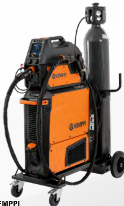
KEMPPi MasterM 355 Puls (Auto-Puls) wassergekühlt inkl. Drahtvorschubrollenset 1,0 mm, V-Nut glatt und Fahrwagen P45MT

Katalog: KEMPPi- Special Seite 6 Art.-Nr.: P502CGX4