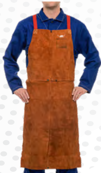
Schweißer-Lederschürze Katalog Seite: 279