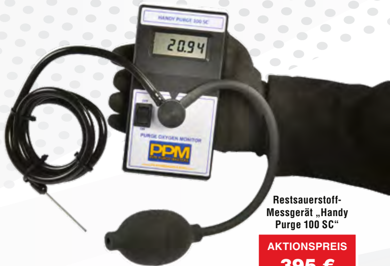
Restsauerstoff- Messgerät „Handy Purge 100 SC“