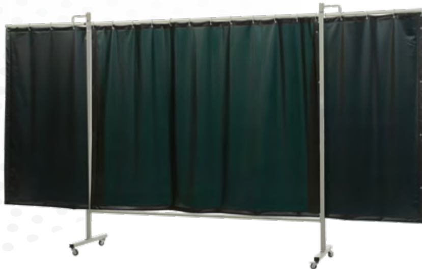
Stellwände OMNIUM, 3-tlg., mit Folienvorhang Katalog Seite: 343