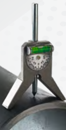
Zentrierkörner für Rohr-Ø bis 1-8 Zoll