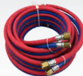
Autogen-Zwillingsschläuche konfektioniert Sauerstoff/Acetylen, 6/9 mm Innen-Ø Katalog Seite: 214