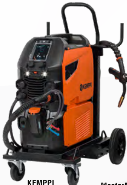
KEMPPi MasterM 353 Synergic (Auto) wassergekühlt inkl. Drahtvorschubrollenset 1,0 mm, V-Nut glatt und Fahrwagen P45MT