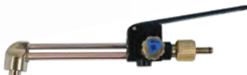
Schneideinsätze STAR mit Federhebel Katalog Seite: 175