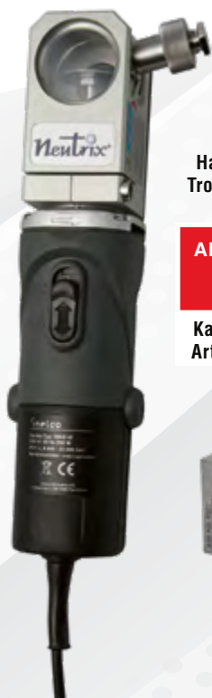
Hand-Elektroden- Trockenschleifgerät „Neutrix“